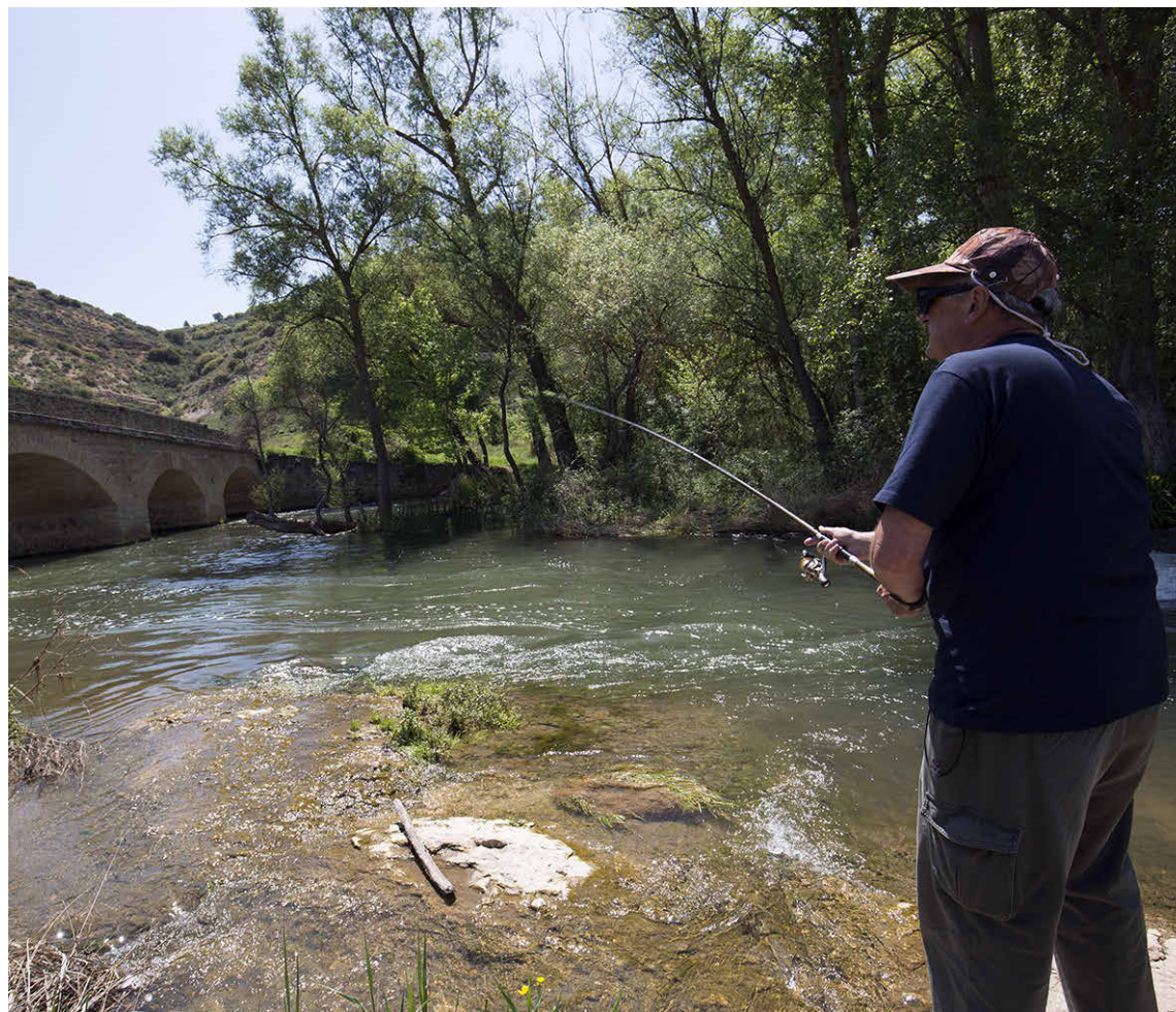
Un pescador practica la pesca en un río de Guadalajara.

Además, se prohibieron las sueltas de trucha arco iris estériles monosexo en cotos intensivos, que para mas señas, eran las ya realizadas por las propias autoridades ambientales desde hace décadas y sin ningún impacto negativo para la Biodiversidad. Dichos cotos han tenido que cerrar con pérdidas millonarias en términos de empleo, daños económicos y valor social. En caza, una importante especie cinegética murciana, el arruí o muflón del Atlas, ha sido condenada a su erradicación porque resulta que no es autóctona (es originaria de Marruecos),